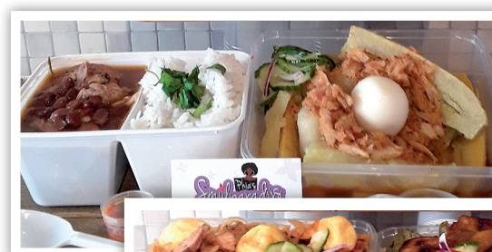
Voorbeeld foto's Phia's maaltijd